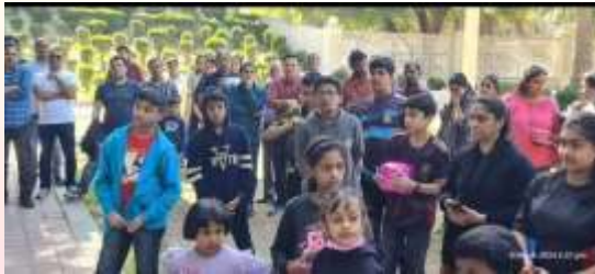
Edvaka Picnic 08/03/24