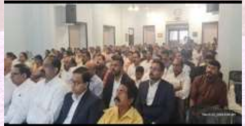
Joint Holy Communion St.James St.Johns & St.Peters MTCs' on 22/03/24