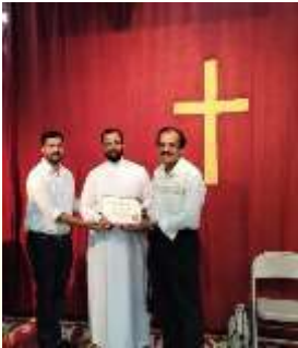
Best Parish Award 2022-2023. Handing over to Vicar