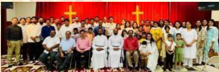
Yuvavedi – 22 Sept 2023