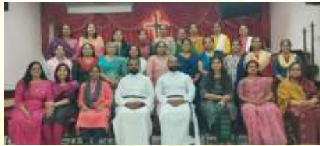
Vanithvedi – 30 Sept 2023